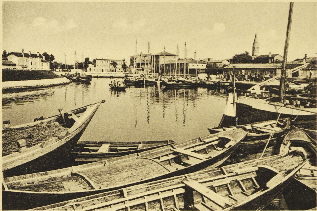
Caorle - Barche alla Fonda