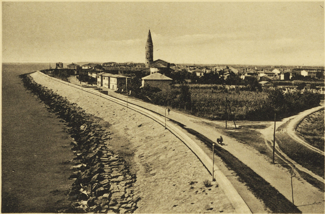
Caorle - Panorama