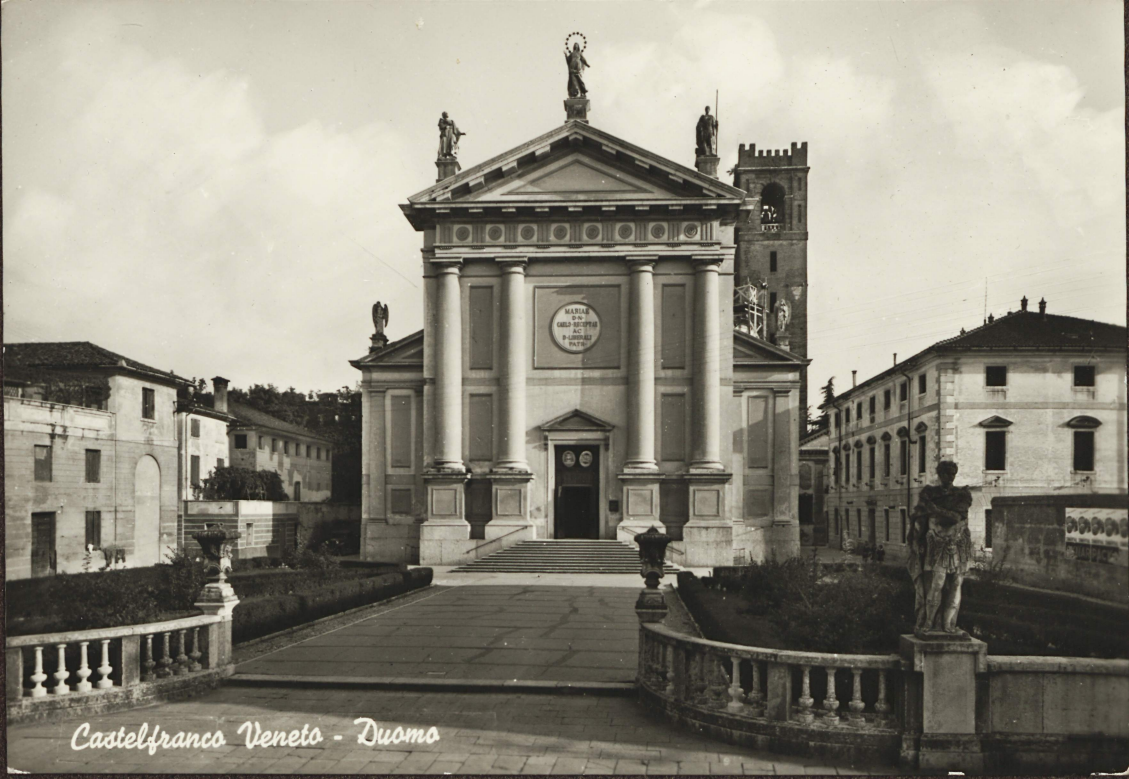
Castelfranco Veneto - Duomo