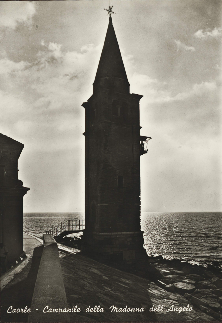
Caorle - Campanile della Madonna dell'Angelo