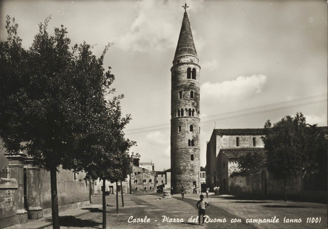
Caorle - Piazza del Duomo con campanile (anno 1100)