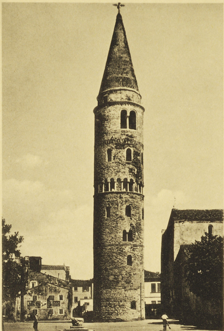
Caorle - Campanile del Duomo (a. 1100)