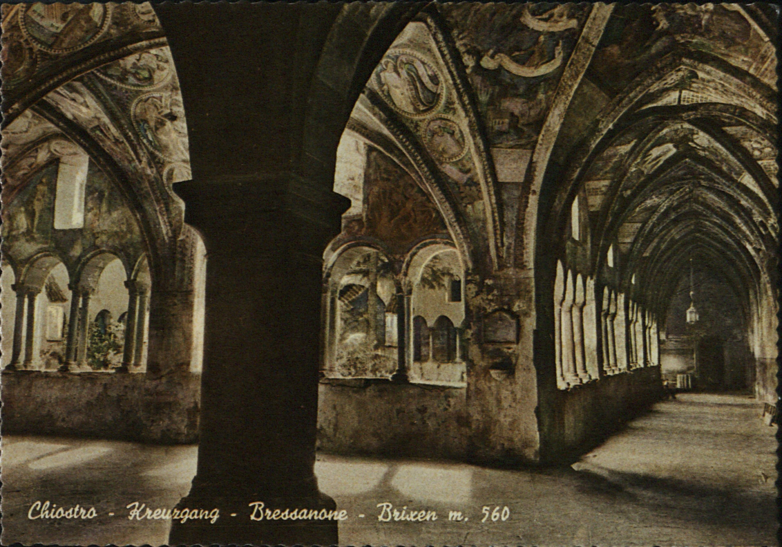
Chiostro - Kreuzgang - Bressanone - Brixen m. 560