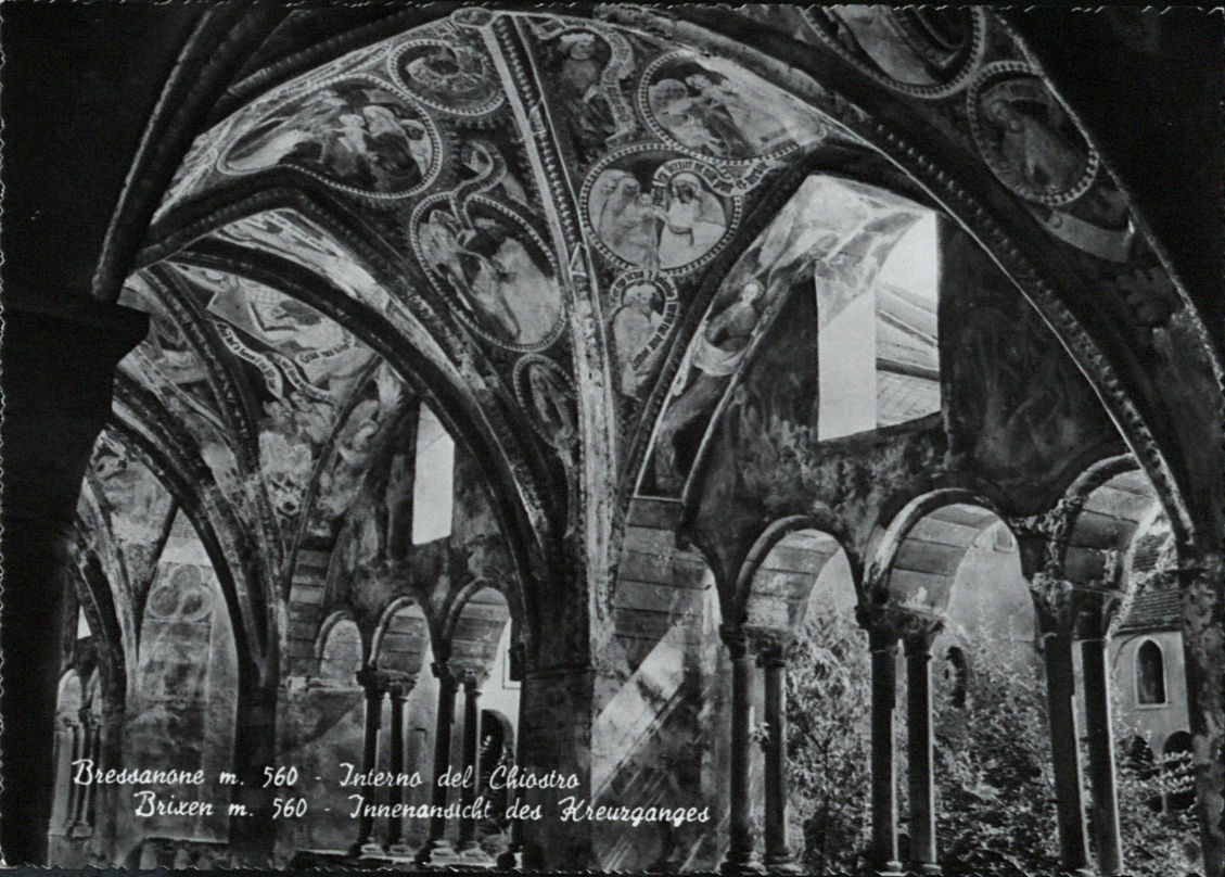
Bressanone m. 560 - Interno del Chiostro Brixen m. 560 - Innenansicht des Kreuzganges