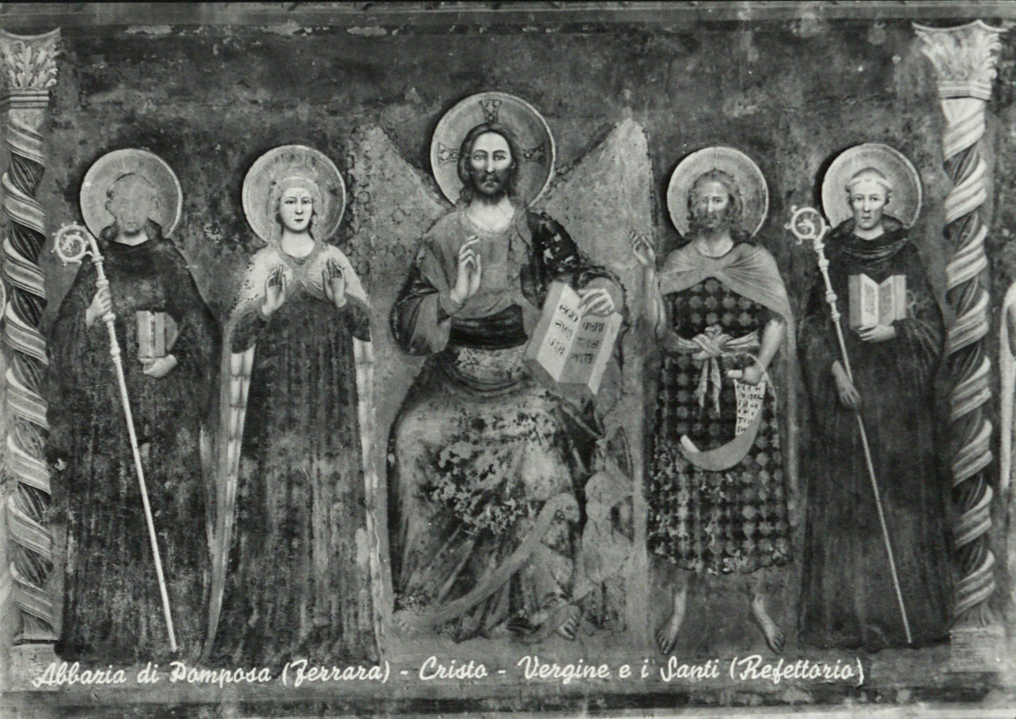
Abbazia di Domposa (Ferrara) - Cristo - Vergine e i Santi (Refettorio)