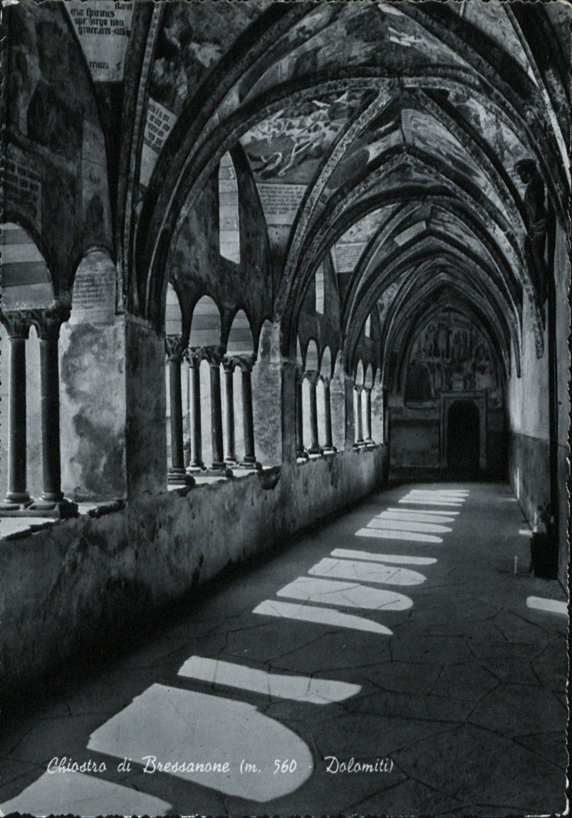
Chiostro di Bressanone (m. 560 - Dolomiti)