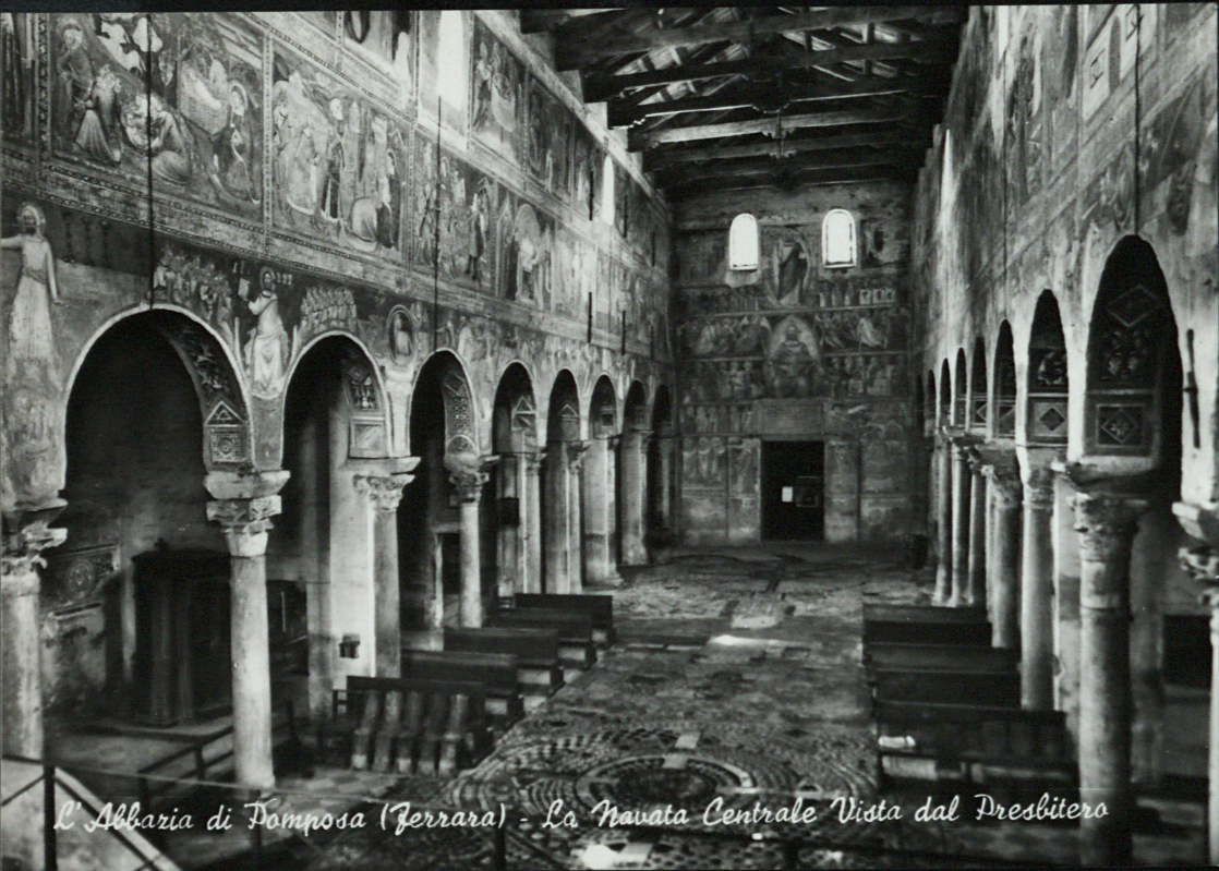
L'Abbazia di Pomposa (Ferrara) - La Navata Centrale Vista dal Presbitero